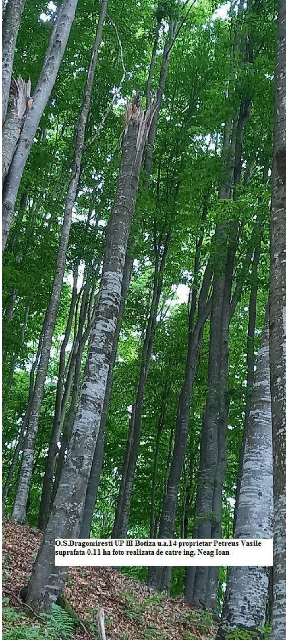
O.S.Dragomiresti UP III Botiza u.a.14 proprietar Petreus Vasile suprafata 0.11 ha