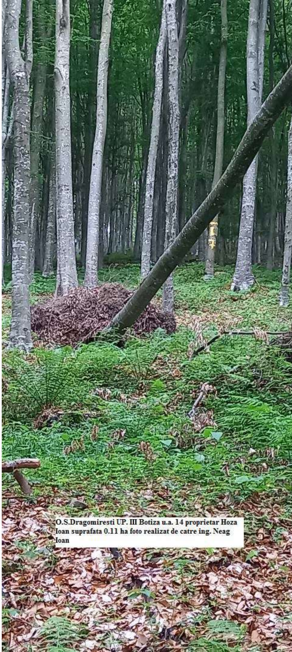
O.S.Dragomiresti UP. III Botiza u.a. 14 proprietar Hoza Ioan suprafata 0.11 ha